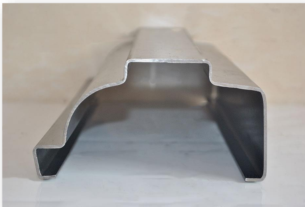
پروفیل مکزیکی برون

وزن پروفیل مکزیکی نسبتا بالا و وزن هر شاخه آن نسبت به پروفیل فرانسوی چیزی در حدود 15 درصد بیش تر است. در مقام مقایسه پروفیل فرانسوی و مکزیکی با طول 6 متر و ضخامت 2 میلی متر، به ترتیب حدودا 24 تا 28 کیلوگرم وزن دارند.